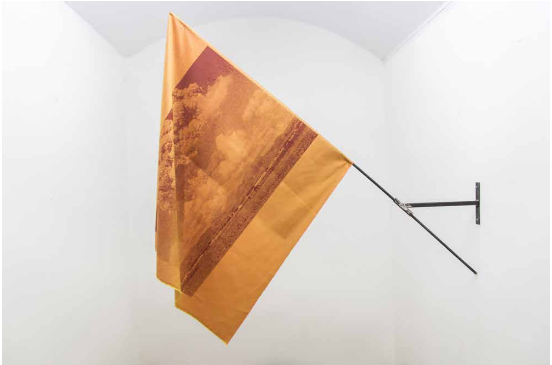
Vue de l'exposition Reject Grip Ghostly, au Greyligh Projects (2017). Quand le vend souffle. Tige de métal 2m, tissus de soie 90x90cm, encre de sérigraphie.