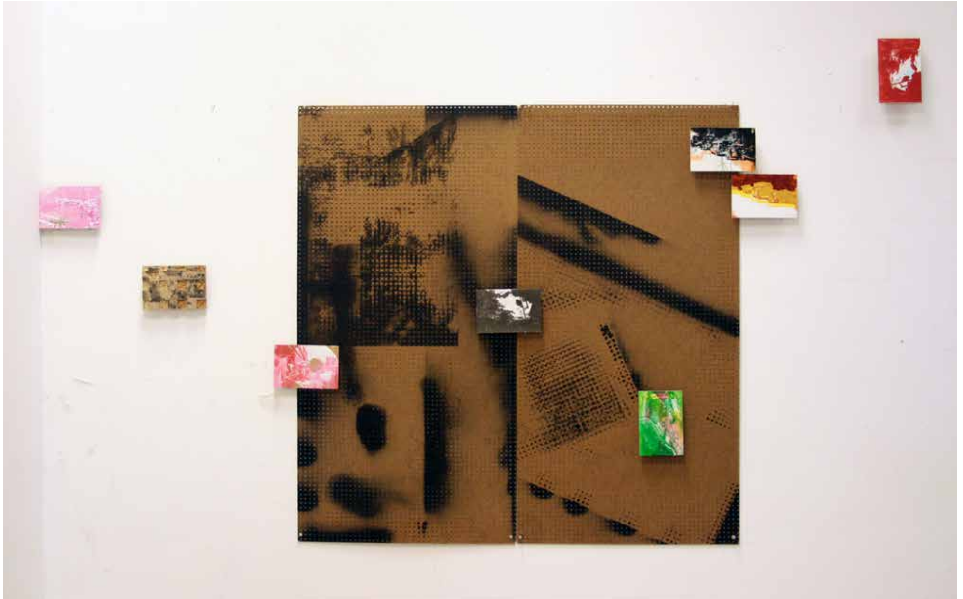
Ensemble N°2 - projet en cours (2018), deux panneaux de masonite perforé : 120x60cm, bombes de peinture noire, huit planches de mdf : 12x18cm, encres de sérigraphies, gouache, crayons de couleurs.