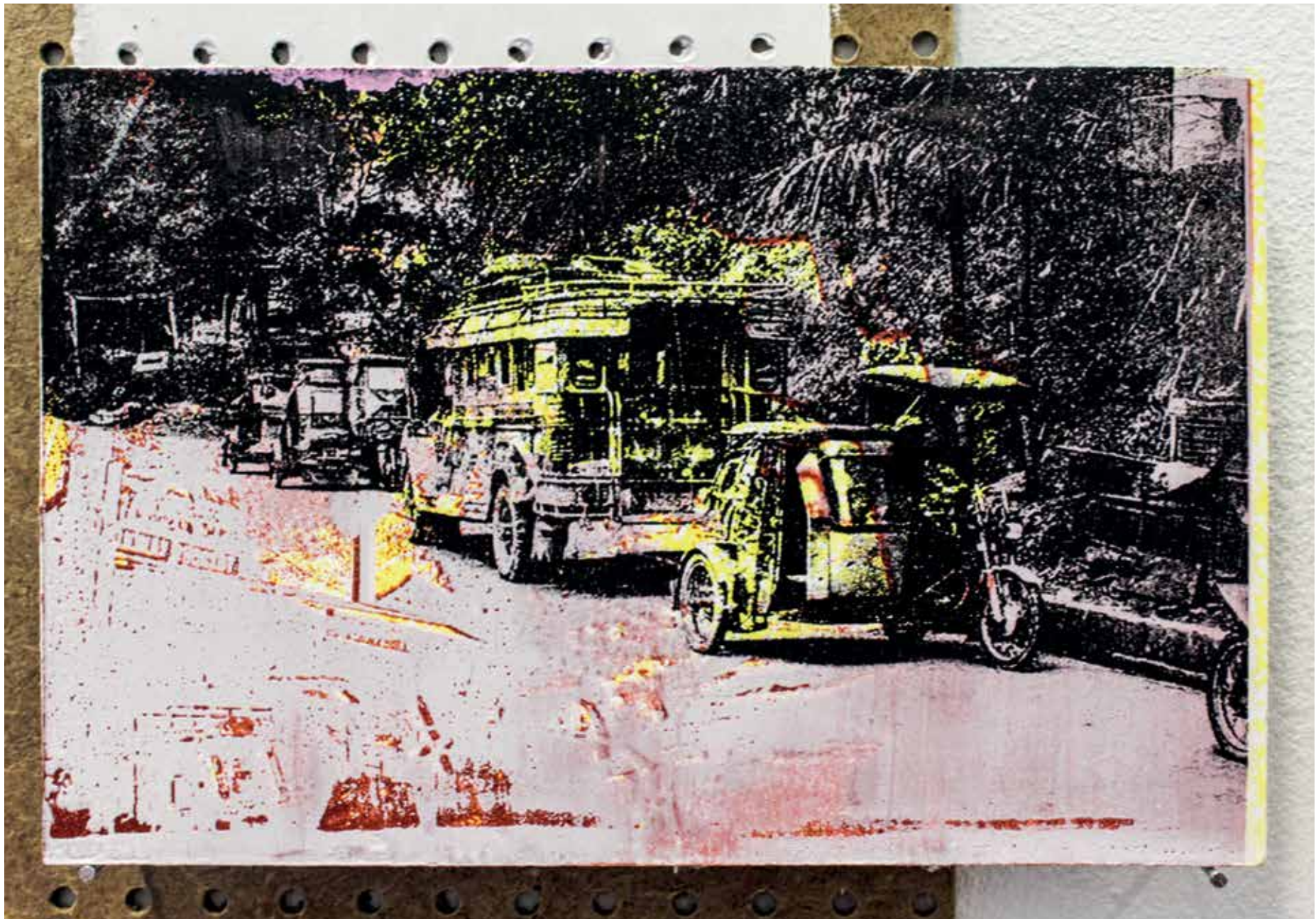
Extrait n°2, vue du projet Fragments en cours , mdf 12x18cm, encres de sérigraphies, crayons de couleurs (2018).